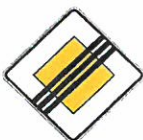
«Конец главной дороги»

Дорога, на которой предоставлено право преимущественного проезда нерегулируемых перекрестков.