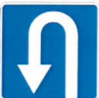
«Место для разворота»