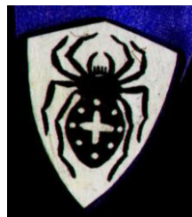
Рисунок 6. Медальон «Паук»