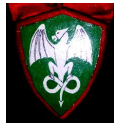
Рисунок 9. Медальон «Дракон»

Восхождение по орденской лестнице званий является дополнительным стимулом для освоения учебного материала. Осваивая образовательную программу, учащиеся получают знания об изучаемой эпохе, имеют возможность экипироваться и научиться сражаться, как подобало средневековому воину, что способствует лучше исполнять свою роль во внутриклубной игре.