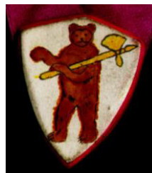
Рисунок 7. Медальон «Медведь»