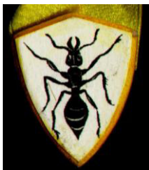
Рисунок 5. Медальон «Муравей»

С каждым повышением в звании количество знаков, необходимое для очередного повышения, возрастает. Так, для первого повышения достаточно одного знака; для второго – три; для третьего – пять и так далее до последнего повышения, для которого требуется отдать 9 знаков. При получении званий, начиная со звания «Муравей», вручается медальон, соответствующий званию (Рисунки 5-9.).