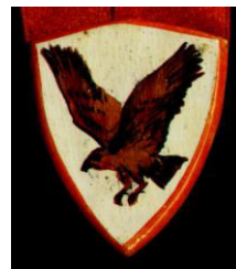
Рисунок 8. Медальон «Ястреб»